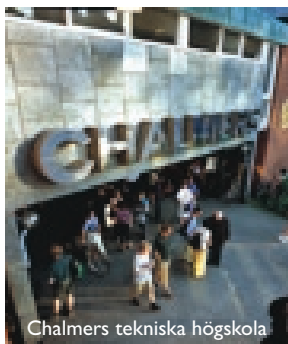
Chalmers tekniska högskola