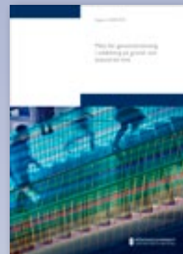
Mått för genomströmning i utbildning på grund- och avancerad nivå

Till sist säger hon att hon skulle välkomna en diskussion om vad man menar med genomströmning. Ska studenterna ut fortast möjligt? Är det ett misslyckande om en student inser att han eller hon valt fel och byter utbildning? Är det verkligen meningsfullt att definiera genomströmning genom att mäta examensfrekvens? Kanske är det dags att definiera om begreppet ... ■