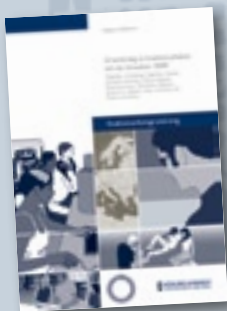
Granskning av kvalitetsarbetet vid nio lärosäten, rapport 2009:8 R går att beställa eller ladda ner från www.hsv.se