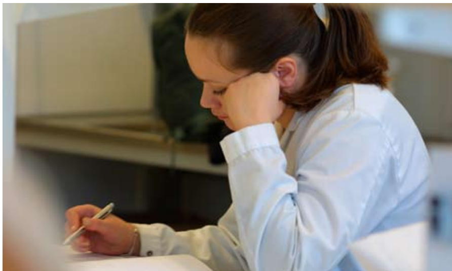
Malmö högskola bör se över rutinerna för omtentamen och uppsamlingsprov.

I ärendet framkom också att den aktuella kursen bara examineras vid det ordinarie tentamenstillfället, som är en gång per år. Högskoleverket har i rapporten Rättsäker examination framfört att det framstår som alltför lång tid att ett omprov hålls två må-